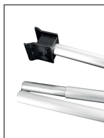
Mât élastique 3 parties