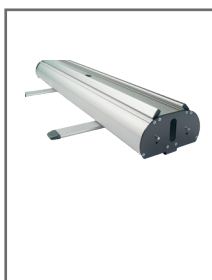
Carter avec pieds stabilisateurs

Les gabarits d'impression mis à disposition sont fournis à titre indicatif. Ils tiennent compte de procédés internes qui peuvent varier selon vos équipements, matières & finitions. En cas d'impression par vos soins, il vous appartient de tester au préalable la compatibilité de votre media avec le produit avant utilisation.